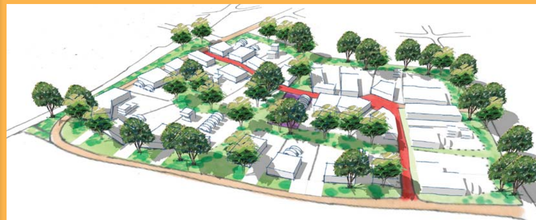
Simulation 3D avec des toits terrasses uniquement

Proposition de plan de composition : des implantations à l'alignement ou en retrait, des espaces de stockage et de parking à l'arrière des parcelles, des espaces dédiés aux piétons (places, cheminements doux, espaces verts), une trame d'espaces verts importante. Espace de stationnement commun. L'espace entre les voies et les parcelles reste dans le domaine public. Le traitement végétal est important.