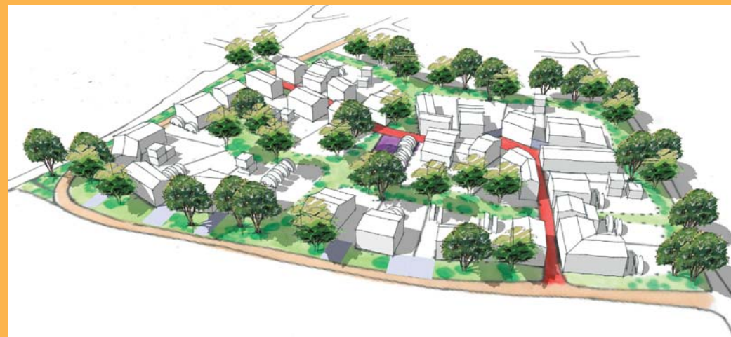
Simulation 3D avec des toits à 2 pentes uniquement