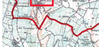
Localisation du projet de nouveau quartier