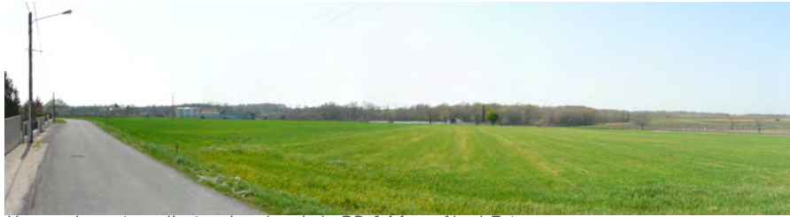
Vue sur le secteur d'extension depuis la RD 144, au Nord-Est