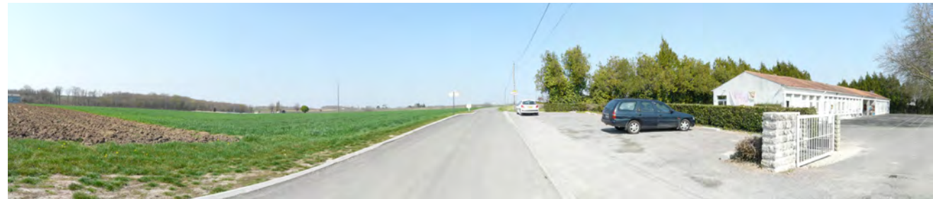
Depuis la RD 144, devant l'école