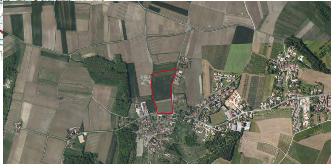
Localisation du projet de nouveau quartier - photo aérienne