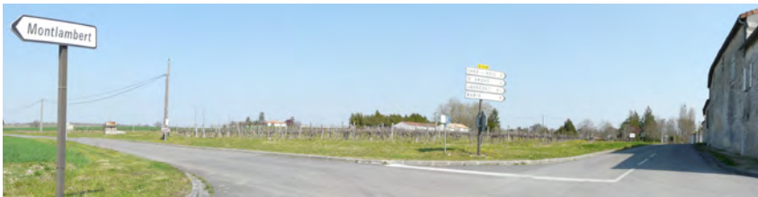
Au carrefour entre la voie communale et la RD 144