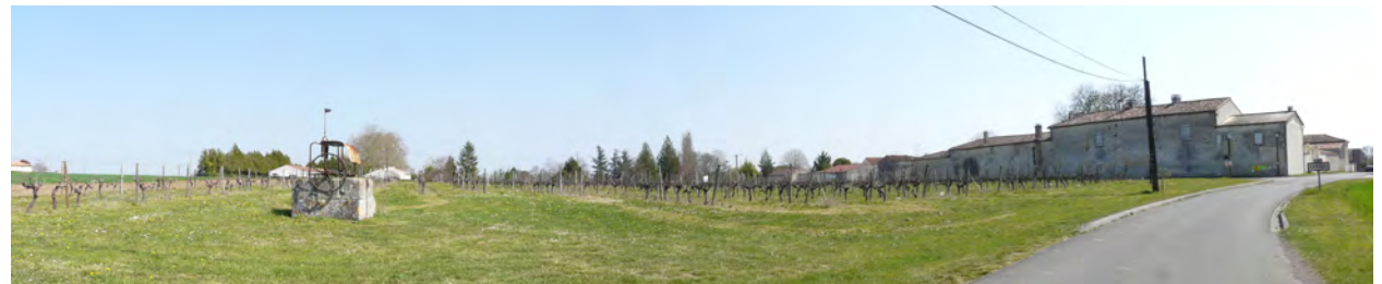
Un puits à maintenir au Sud-Ouest du secteur à urbaniser