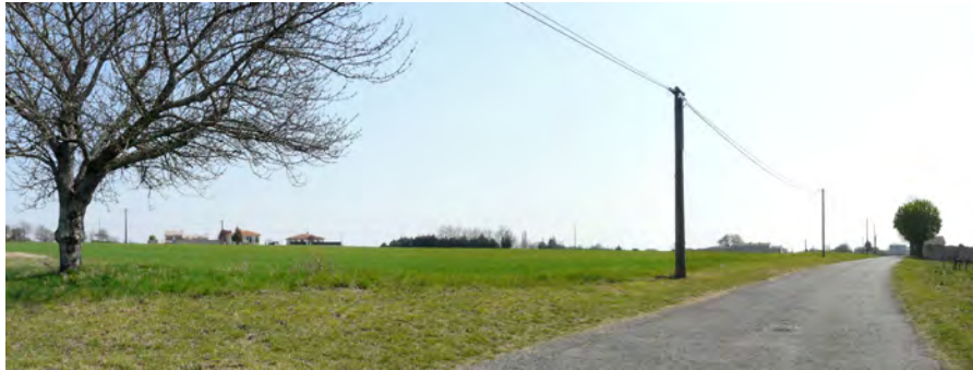
Vue sur le secteur d'extension depuis la voie communale, au Nord-Ouest