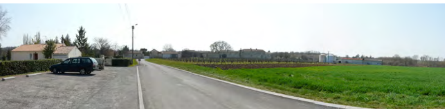
Depuis la RD 144, devant l'école